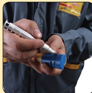
علامت بزنید ...