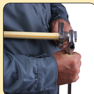
با آچار معمولی پرس کنید.