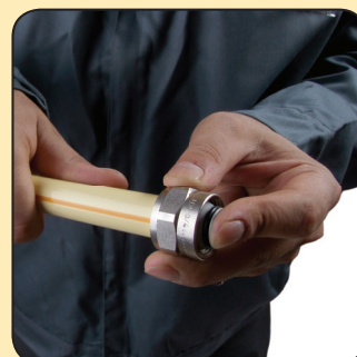
جا بزنید ...