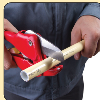
لوله را ببرید ...